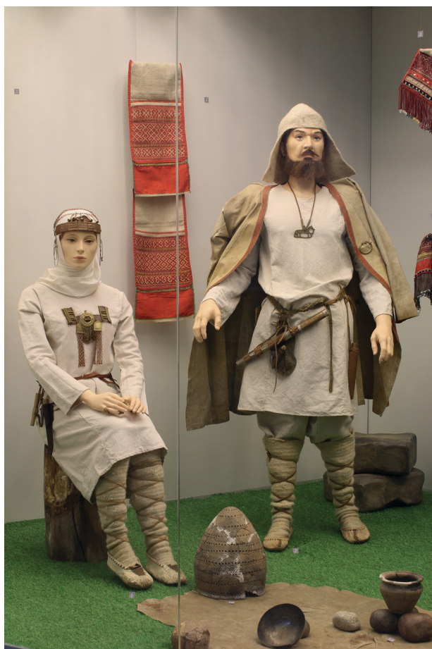
Фото 1. Древнемарийский костюм. Реконструкция. Национальный музей Республики Марий Эл им. Т.Е. Евсеева

Семантическая система традиционного марийского народного костюма и его художественно-образная интерпретация соединяют воедино мировоззренческие, эстетические и художественные представления народа, проявляясь как в утилитарном, так и в декоративном предназначении [10, с. 7]. Современные исследователи провозглашают тезис,