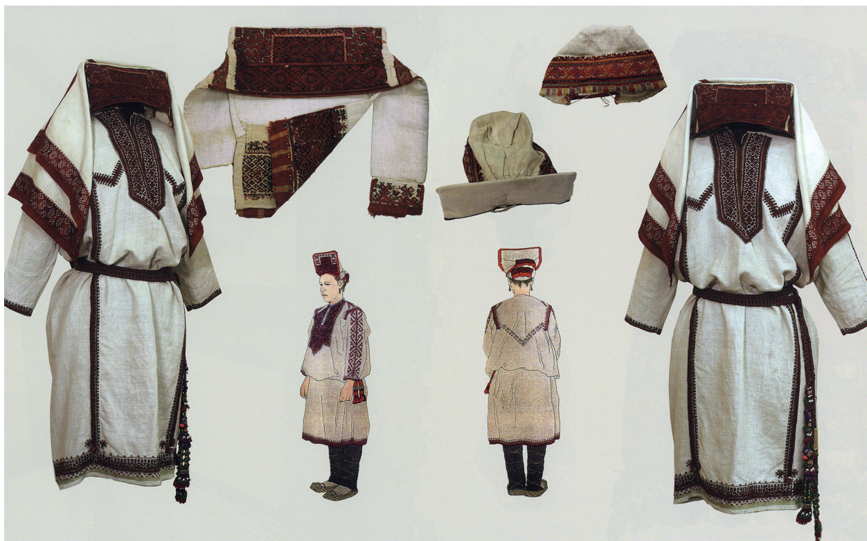
Фото 4. Костюм луговой марийки с головным убором сорока.