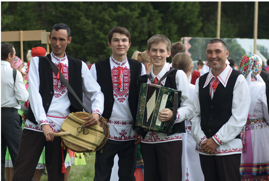
Фото 9. Современный марийский мужской костюм