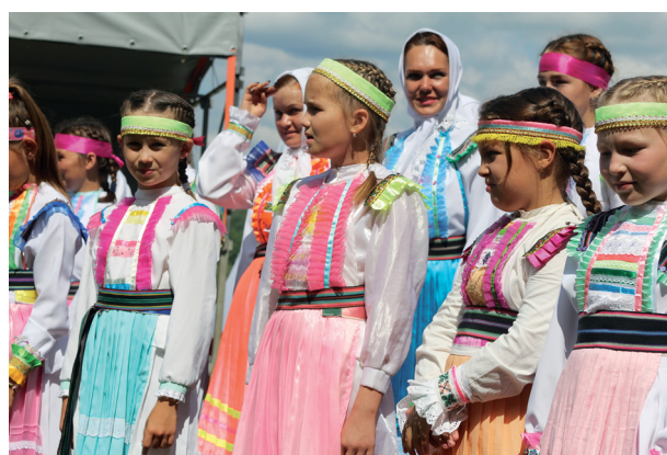
Фото 7. Современный костюм горных мари

опоясывались ремнём с медными и железными пряжками, а в праздники — красным шерстяным поясом с кистями и ремешками, вырезанными из шкуры жертвенного животного. Пояса были кожаные, также тканые шерстяные, шёлковые и конопляные. Праздничные пояса богато декорировались бисером, серебряными монетами, вышивкой. Широкие домотканые кушаки использовались для опоясывания верхней одежды. Холщовые пояса в виде полотенца с вышитым или тканым узором надевались во время языческих молений, проводимых в священных рощах.