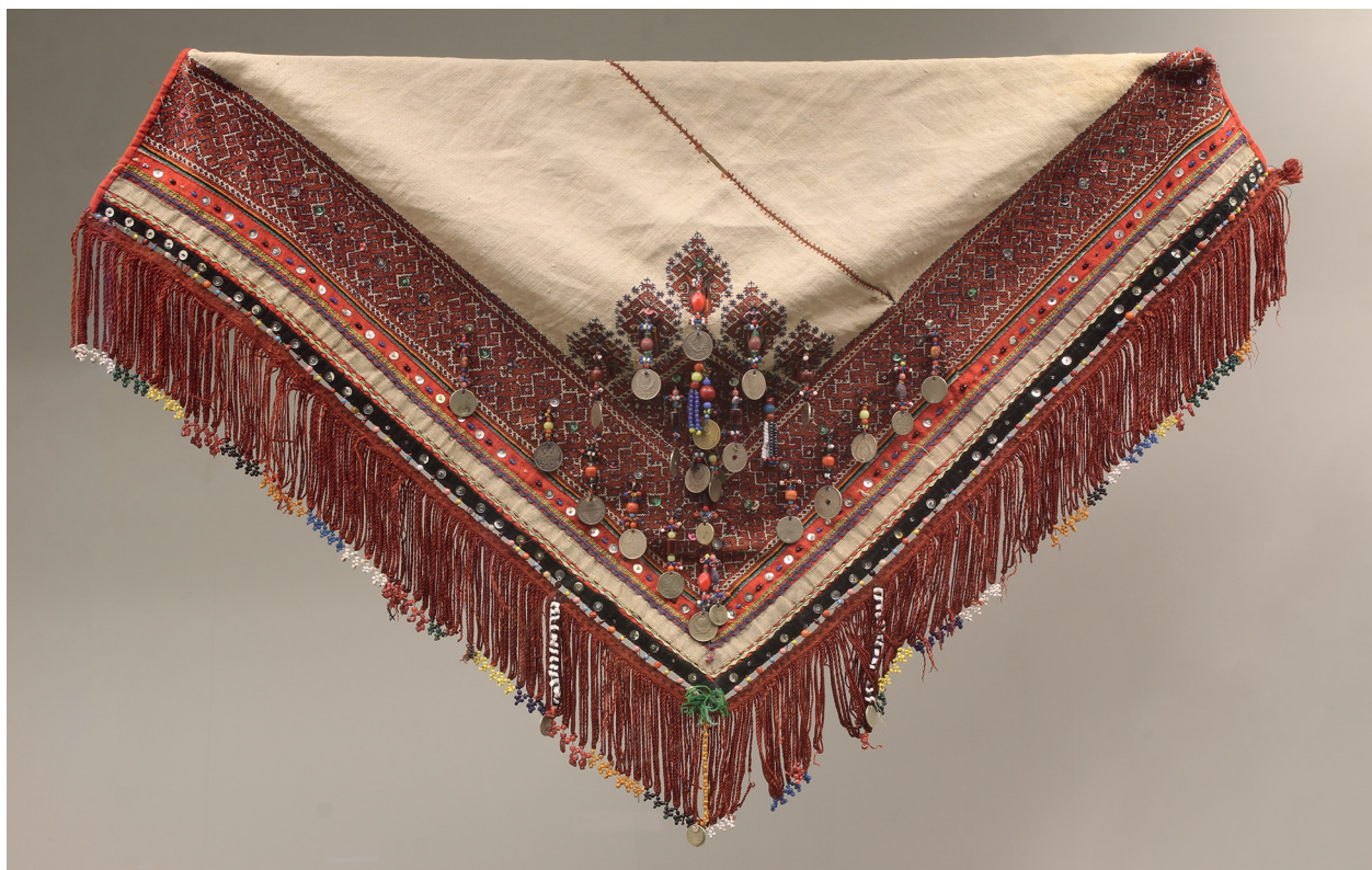
Фото 6. Свадебный платок.