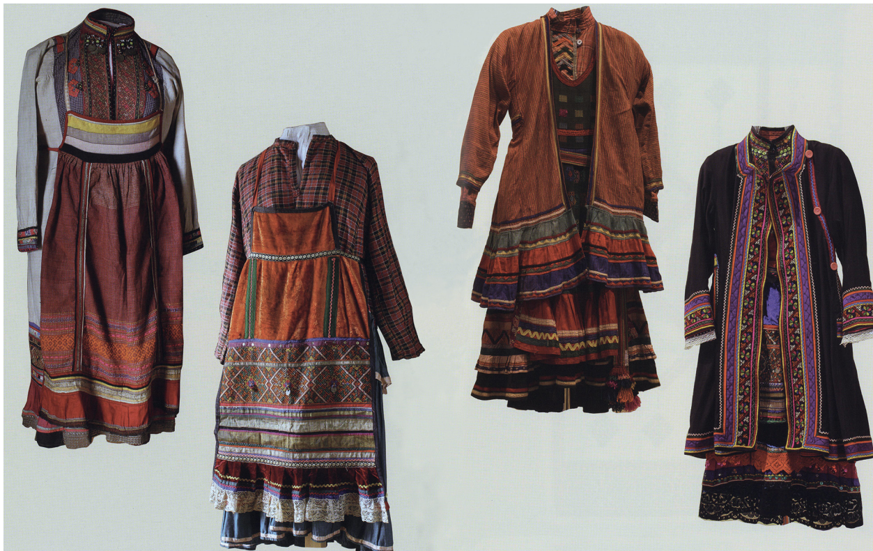
Фото 5. Женский костюм восточных мари.