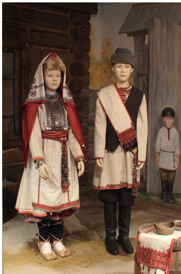
Фото 2. Свадебный костюм луговых мари. Конец XIX — начало XX века. Из фондов Национального музея Республики Марий Эл им. Т.Е. Евсеева

что изобразительные методы самовыражения традиционных культур, их абстрагированное или знаковое изображение мира неизменны [4, с. 4].