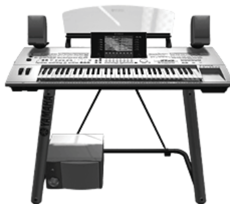
Рис. 6. Рабочая станция фирмы Yamaha — новый электронный музыкальный инструмент

— это «набор сэмплированных и/или синтезированных звуков и параметров для их воспроизведения, предназначенный для управления с клавиатуры или через MIDI-интерфейс» xxv .