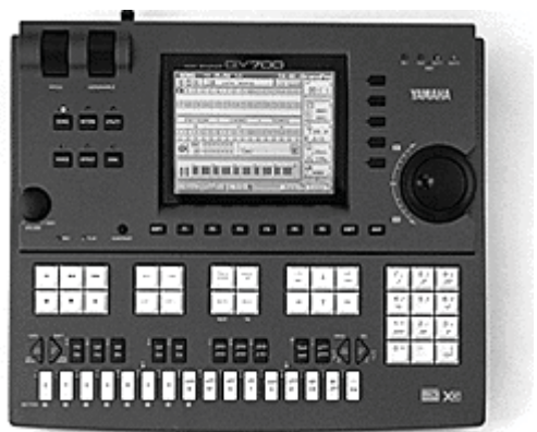
Рис. 5. Music Sequencer фирмы Yamaha с семплерными возможностями

Это также может быть модуль с синтезаторными и семплерными возможностями.