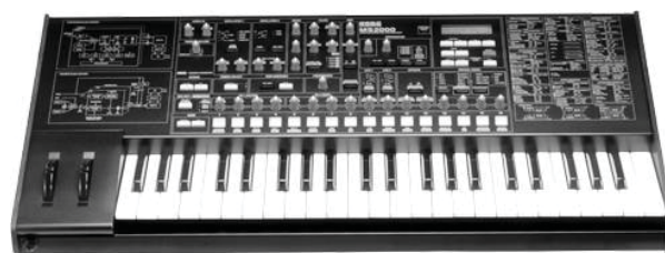
Рис. 2. Клавишная модификация аналогового синтезатора фирмы Korg

ЭМИ — это мультиинструмент, он обладает мегатембровой полифункциональностью. Необходимо отметить, что в традиционной музыкальной культуре мы привыкли понимать под музыкальным инструментом конкретный физический объект , с помощью которого можно создавать (синтезировать) музыкальные звуки определенного (характерного) тембра. Однако в сфере МКТ, в компьютерном музыкальном творчестве понятием «инструмент» определяют более широкую категорию устройств; «музыкальным инструментом» в данном случае может быть и внешний звуковой модуль с клавиатурой (см. рис. 2), и его рэковая модификация (рис. 3), и звуковой модуль (рис. 4), содержащий сотни, тысячи «инструментов» («банки» электронных инструментальных звуков).