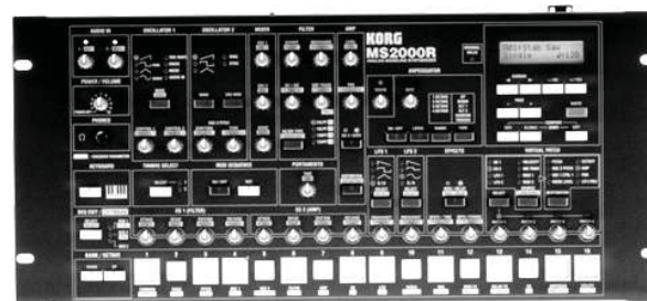
Рис. 3. Рэковая модификация аналогового синтезатора фирмы Korg

В такой «музыкальный инструмент», изначально содержащий десятки тысяч «инструментов», можно загрузить их ещё сколько угодно и каких угодно (выбор зависит только от репертуара, тонкости музыкального восприятия, замысла композитора, его художественно-эстетического вкуса и др.).