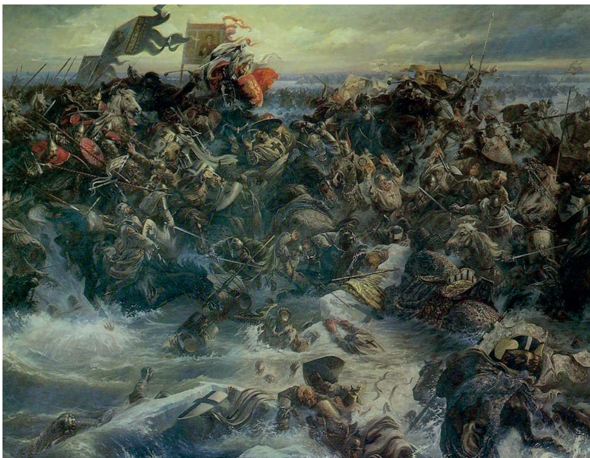
Ил. 4. В.М. Назарук. «Ледовое побоище». 1982. Холст, масло. 280×401.

Государственный исторический музей, Москва, Россия