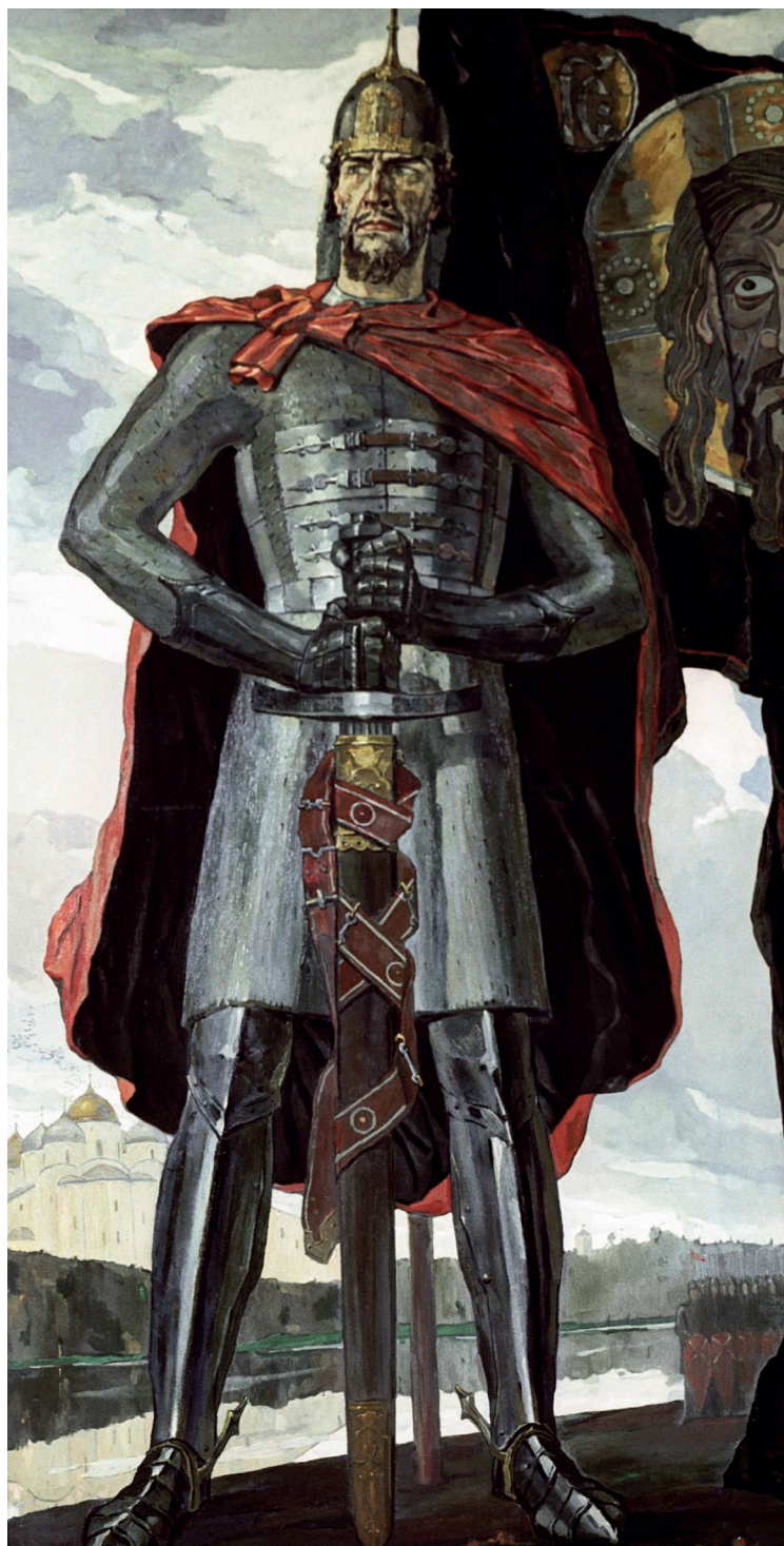
Ил. 1. П.Д. Корин. «Александр Невский». Центральная часть триптиха. 1942. Холст, масло. 275×142.

Государственная Третьяковская галерея, Москва, Россия