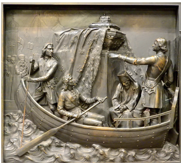
Ил. 2. Пётр I перевозит мощи Александра Невского в Санкт-Петербург. Рельеф на двери. Исаакиевский собор, Санкт-Петербург, Россия Il. 2. Peter I Transports the Relics of Alexander Nevsky to St. Petersburg. The Relief on the Door. St. Isaac's Cathedral, St. Petersburg, Russia