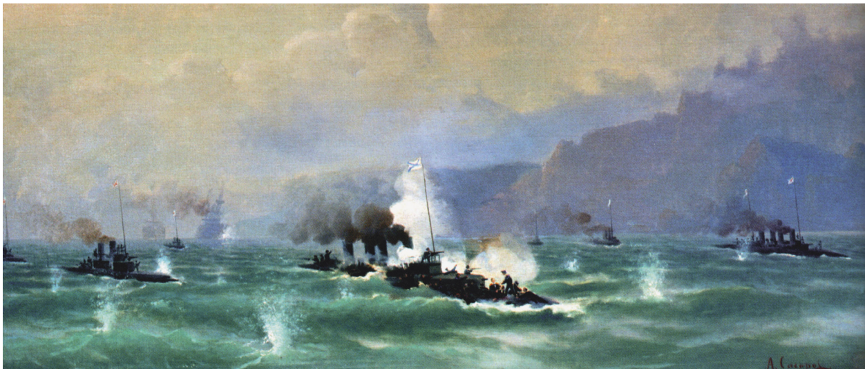
Ил. 2. А.А. Сахаров. «Бой эскадренного миноносца „Страшный” с шестью японскими миноносцами в ночь на 31 марта 1904 года». 1904–1906. Холст, масло. 56×104 7

ти исчезнувшие из нашей общественной памяти события художественной жизни Приморья второй половины XIX и начала XX веков. Он показал в том числе и истоки региональной маринистики. Так, анализируя развитие морского пейзажа в начале XX века, он как «живописца-про-