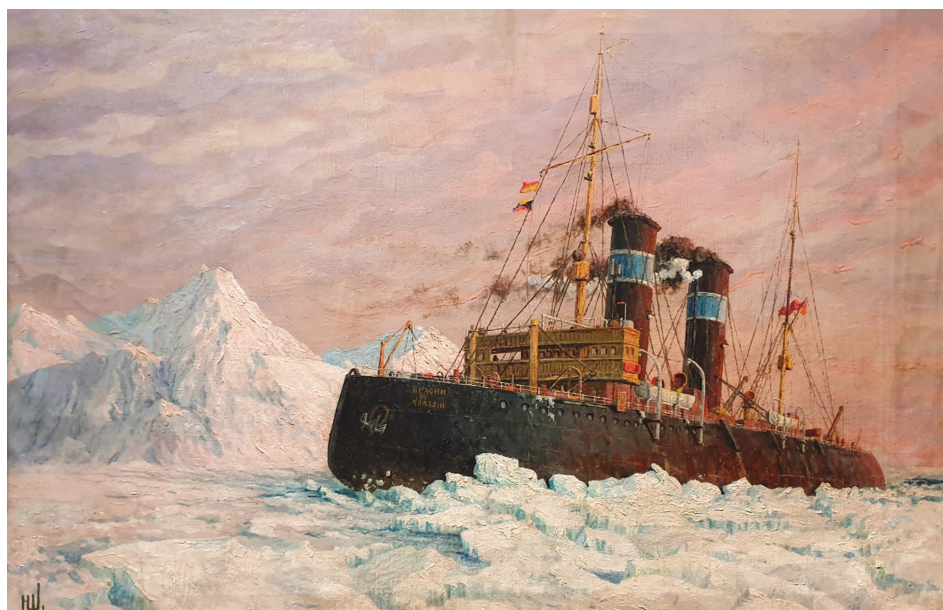
Ил. 3. Н.М. Штуккенберг. «Ледокол „Красин” во льдах». 1936. Холст, масло. 68,5×103. Приморская государственная картинная галерея. Из коллекции Владиславы Матвеевны Бовкевич 8

фессионала» в первую очередь отмечает А.А. Сахарова (ил. 2) [9, с. 45–47]. Опубликованы десятки статей, в том числе и В.И. Кандыбы [10, с. 6, 102], о творчестве Н.М. Штуккенберга (ил. 3) и П.П. Куянцева — профессиональных моряков, капитанов-маринистов. Произведениям