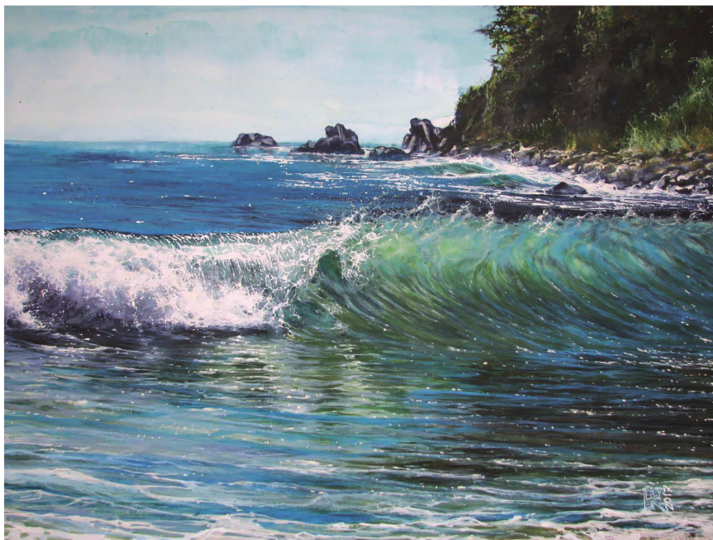
Ил. 6. Р.В. Гвоздев. «Зелёная волна». 2017. Бумага, акварель, белила. 48×62. Частная коллекция 12