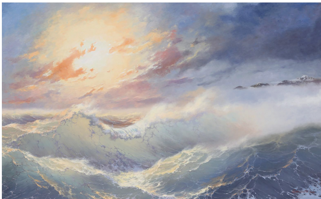
Ил. 7. В.И. Шиляев. «Великий, но не тихий океан». 2016. Холст, масло. 160×260. Частная коллекция 13

Также можно предложить разновидность жанра марины с точки зрения пространственных особенностей взгляда художника — с берега или с палубы корабля. Например, «Взморье» вобрало бы в себя виды морских побережий и всё, что связано с ними. «Большой энциклопедический словарь» так определяет «взморье»: 1) часть поверхности моря, прилегающая к берегу; 2) приморская полоса суши [4]. Подсказана самой современной жизнью и такая разновидность жанра, как «Регата».