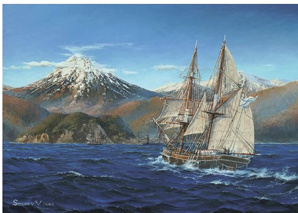
Ил. 4. В.И. Шиляев. «Шхуна „Хеда” у берегов Камчатки». 2008. Оргалит, масло. 50×70. Частная коллекция 10

В.И. Шиляева (ил. 4) неоднократно давалась высокая оценка искусствоведами Л.И. Варламовой [2, 3] и О.И. Зотовой [6, с. 21; 7, с. 16; 8]. Следует особо выделить роль этого мариниста, 13 лет работавшего непосредственно в море на рыболовецких и транспортных судах, в воссоздании точных образов легендарных кораблей Тихого океана на безупречно отображённых им таких разноликих морских и океанских волнах [11, с. 323–329] 9 .