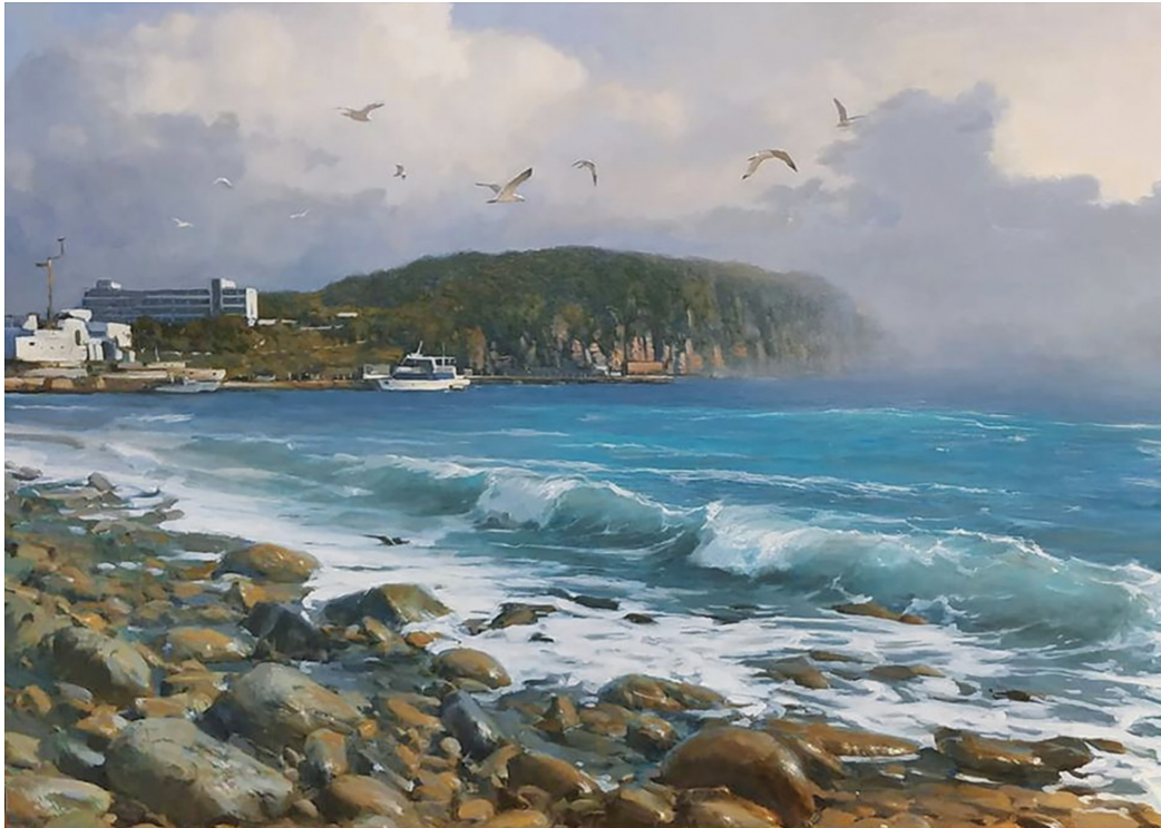
Ил. 5. С.А. Коновалов. «Полуостров Басаргина». 2019. Холст, масло. 70×50. Частная коллекция 11